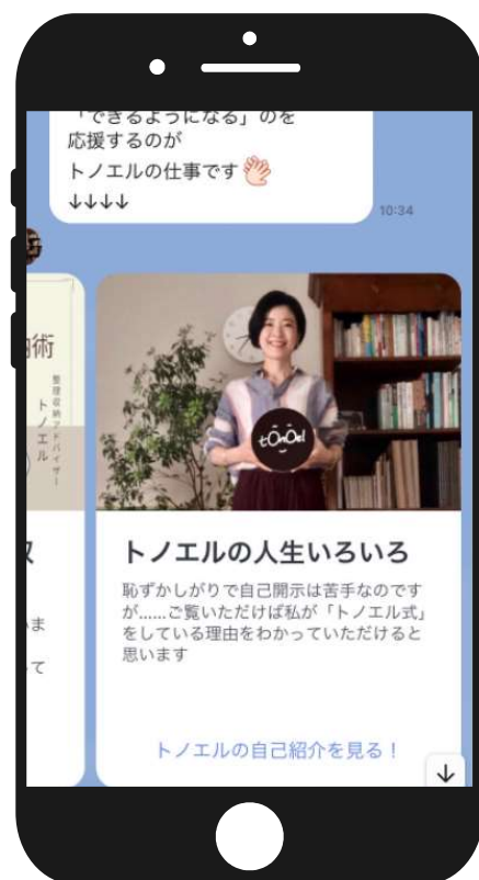
▲「見る！」でようやくトノエル式サイトへ