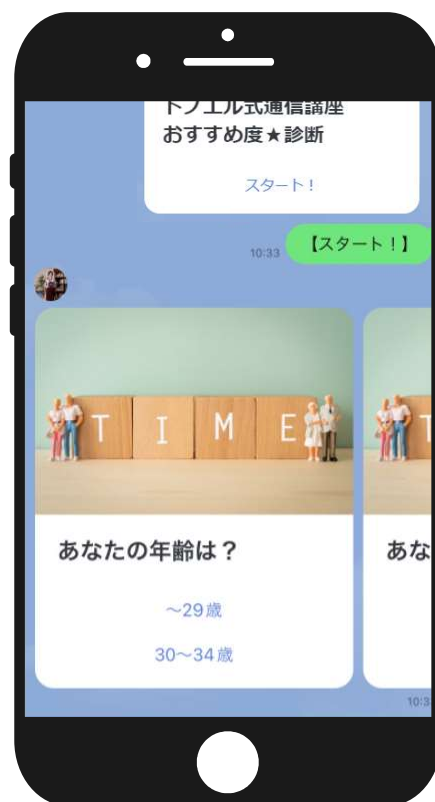
▲「スタート！」や「回答」をタップで自動応答