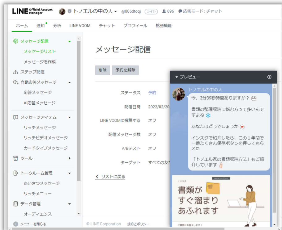
▲パソコンで見るLINE公式アカウントの画面